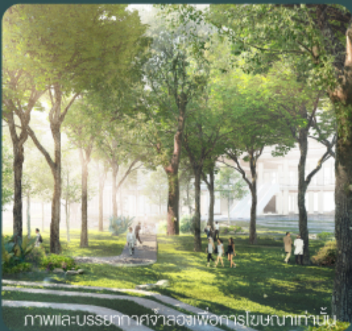
ภาพและบรรยากาศจำลองเพื่อการโฆษณาเท่านั้น