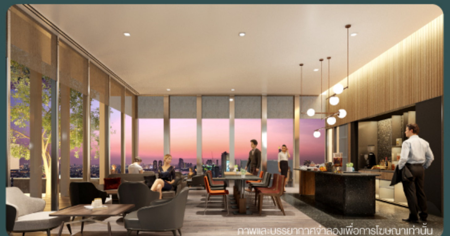
ภาพและบรรยากาศจำลองเพื่อการโฆษณาเท่านั้น