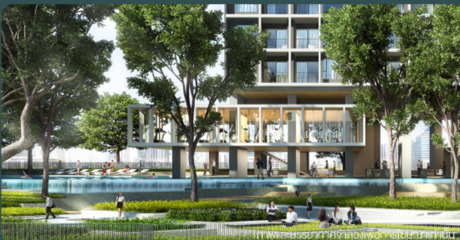
ภาพและบรรยากาศจำลองเพื่อการโฆษณาเท่านั้น