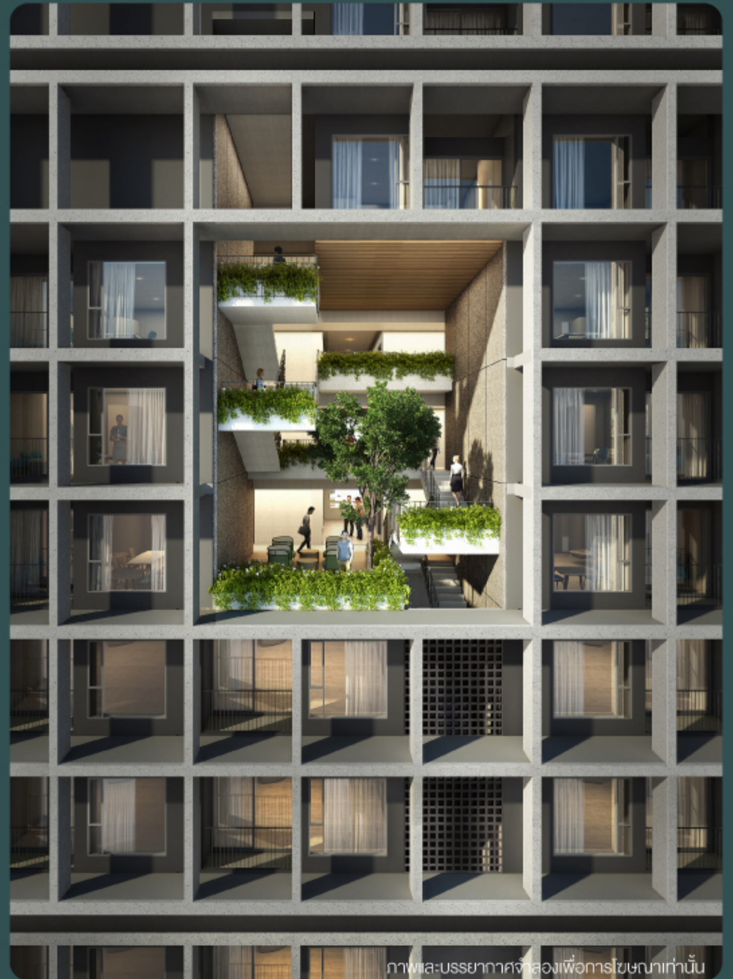
ภาพและบรรยากาศจำลองเพื่อการโฆษณาเท่านั้น