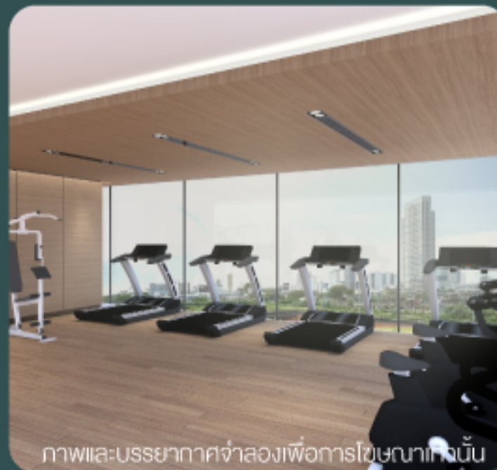
ภาพและบรรยากาศจำลองเพื่อการโฆษณาเท่านั้น